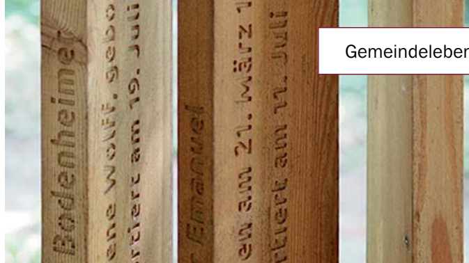
Mahnmal für die jüdischen Opfer der Deportation aus dem Haus Steubenweg 36 (heute Grotiusweg)

Am 19. Juli 1942 wurden die letzten Juden des von den Nationalsozialisten als „Judenhaus“ genutzten Gebäudes im Steubenweg 36, heute Grotiusweg 36, nach Theresienstadt deportiert. Nach den Kenntnissen des „Vereins zur Erforschung der Geschichte der Juden in Blankenese“ kamen durch die nationalsozialistische Verfolgung insgesamt 43 Menschen jüdischen Glaubens, von denen 17 im damaligen „Judenhaus“