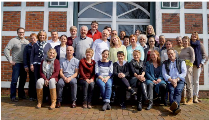
Gospelchor Blankenese beim Probenwochenende in Hüll

Eintritt frei, um Spenden wird gebeten | Info: fragen@gospel-blankenese.de, www.gospel-blankenese.de Wer künftig mitsingen möchte, kann den Chor jeweils nach den Sommerferien oder zum Jahresbeginn kennenlernen.