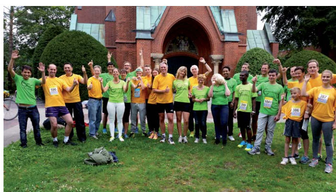
Läuferinnen und Läufer unterstützen die Flüchtlingshilfe und das Hospiz