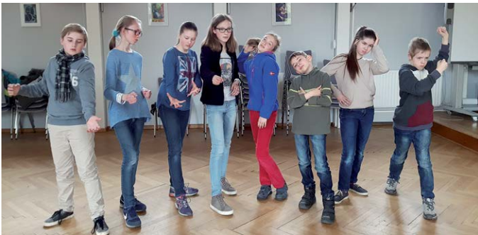
Inklusive Theater-AG probt für „Alles wegen Lotte ...“

Ein Wald, ein verbotenes Haus, ein Schrank! Dies ist der Auftakt einer spannenden Reise zweier Freundinnen, die in verschiedene Welten reisen und dabei auf magische, komische, lustige und interessante Figuren treffen. Lasst euch verzaubern von einem Theaterstück, das Schülerinnen und Schüler der Raphaelschule und des Marion Dönhoff Gymnasiums gemeinsam entwickelt haben.