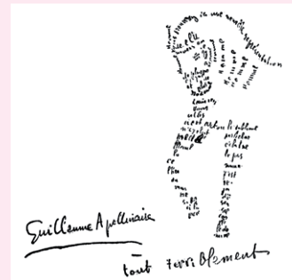
Calligramme v. Apollinaire