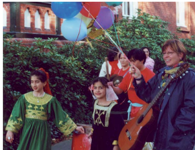
Bunt und fröhlich: ökumenisches Fest für alle

Eintritt frei, Spenden erbeten | www.runder-tisch.blankenese.de