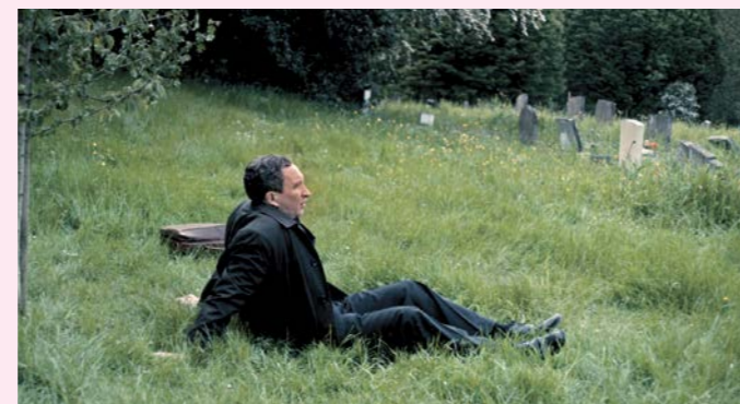
Filmszene aus „Mr. May und das Flüstern der Ewigkeit“

www.blankeneser-gespraechе.blankenese.de