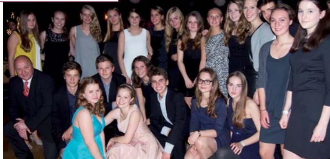
Marafiki-Gruppe beim Charity Ball im November 2014