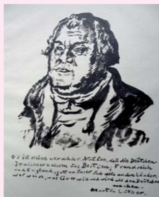
Lovis Corinth: Porträt Martin Luther, Lithographie, 1920