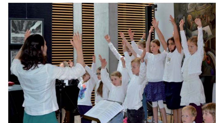
Singschule Blankenese beim Konzert im Juni