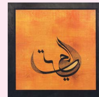
Kalligraphie von S. Alam: Die Freiheit

Eine Kooperation des Zentrums für Mission und Ökumene der Nordkirche, der Hauptkirche St. Katharinen, der Initiative Weltethos e.V. und der Ev. GemeindeAkademie Blankenese, vollständiges Programm: www.gemeindeakademie.blankenese.de