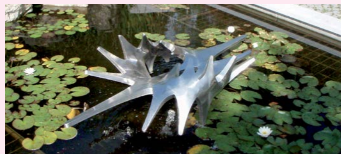
Skulptur von Heinrich Eder: „Der Geist schwebt über dem Wasser“

Auf dem Blankeneser Friedhof befinden sich außergewöhnliche Skulpturen und Kunstwerke, die auf diesem Spaziergang zu entdecken sind: kunstvoll in Form gehauene Steine, fein geschmiedete Grabkreuze, von Barbara Lorenz Höfer gestaltete Urnenstelen sowie ein Stationenweg, auf dem die „Sieben Schöpfungstage Gottes“ in Kunstwerken dargestellt sind.