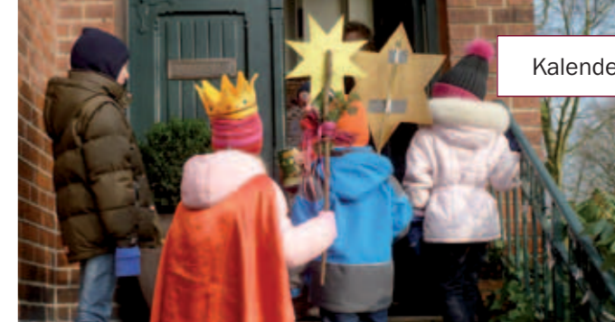
20+C+M+B+15: Sternsinger überbringen Segensgruß

Impressum „Blankeneser Kirche am Markt“ Gemeindebrief Nr. 89 der ev.-luth. Kirchengemeinde Blankenese, Mühlenberger Weg 64a, 22587 Hamburg, Tel. 866250-0 | verantw. Susanne Opatz, Tel. 89709651 Druck: alsterpaper | Auflage: 8.500 | Redaktionsschluss für Februar/März 2015: Di 23.12.2014