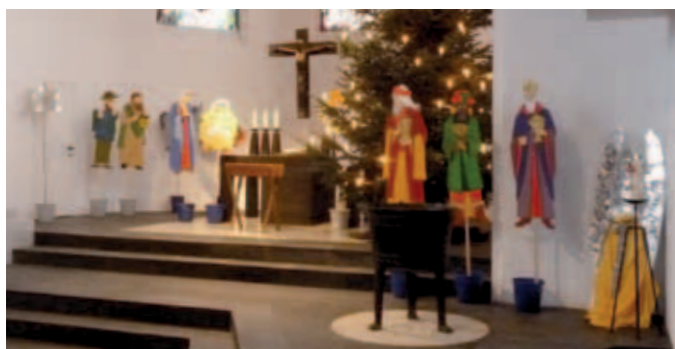
Figuren des Krippenspiels vor dem Einsatz in der Kirche

Eintritt frei | Kontakt: fragen@gospel-blankenese.de www.gospel-blankenese.de