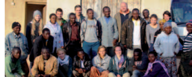
Herbst 2013: Marafiki zu Besuch in Lupombwe

Teilnahme kostenlos, wer mag, gibt eine Spende | verbindliche Anmeldung bis zum 4. Advent, Tel. 866250-0