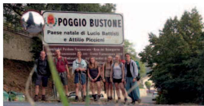
Am Ziel angekommen

Von Assisi bis nach Poggio Bustone im umbrischen Rieti-Tal pilgerten in den Herbstferien Jugendliche aus der Gemeinde gemeinsam mit Pastor Warnke. Den ersten Teil des Pilgerwegs auf den Spuren des Heiligen Franz von Assisi hatte die Gruppe bereits 2012 beschritten. Damals war die Franziskaner-Basilika von Assisi das Ziel – Ausgangspunkt für die diesjährige Wanderung. Insgesamt waren die jungen Pilger neun Tage lang zu Fuß unterwegs, legten eine Strecke von 180 Kilometern zurück, übernachteten in Klöstern oder einfachen Pensionen. An der schönsten Stelle jeder Tagesetappe feierten sie eine Andacht – Kraftquelle und spiritueller Impuls zugleich. Ein herzlicher Dank an den Förderverein, der die Reise unterstützte!