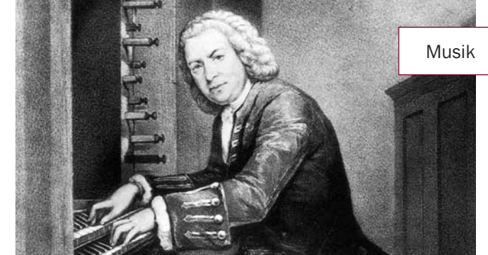
Johann Sebastian Bach (1685 bis 1750)