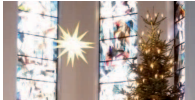
Herrnhuter Stern in der Blankeneser Kirche