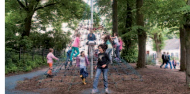
Pause in der Bugenhagenschule