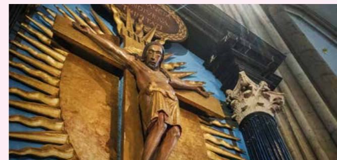
Gero-Kreuz, Kölner Dom