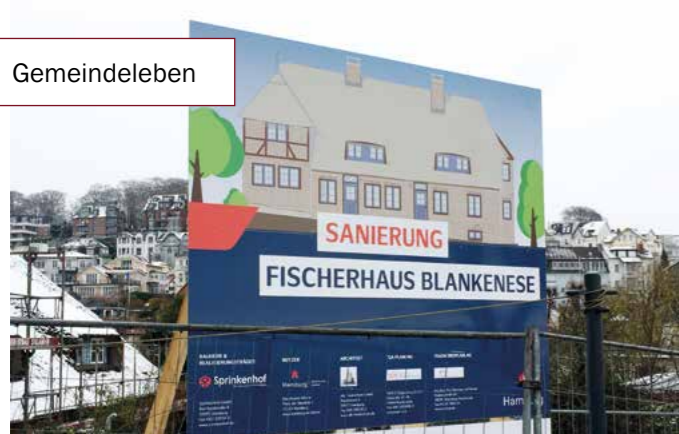
Blick über den Bauzaun

Die Sanierungsarbeiten stehen unter Leitung des auf historische Bauten spezialisierten Architekten Alk Friedrichsen. Er plant als nächsten Schritt, das Gebäude einzuhausen, um im Laufe des Winters die Dachkonstruktion denkmalgerecht zu erneuern und das Dach mit Reet zu decken. Die Landesregierung unterstützt die Arbeiten mit insgesamt 3,5 Millionen Euro. Das Geld stammt aus dem Hamburger Wirtschaftsstabilisierungsprogramm (HWSP), das angesichts der Corona-Krise entwickelt wurde.